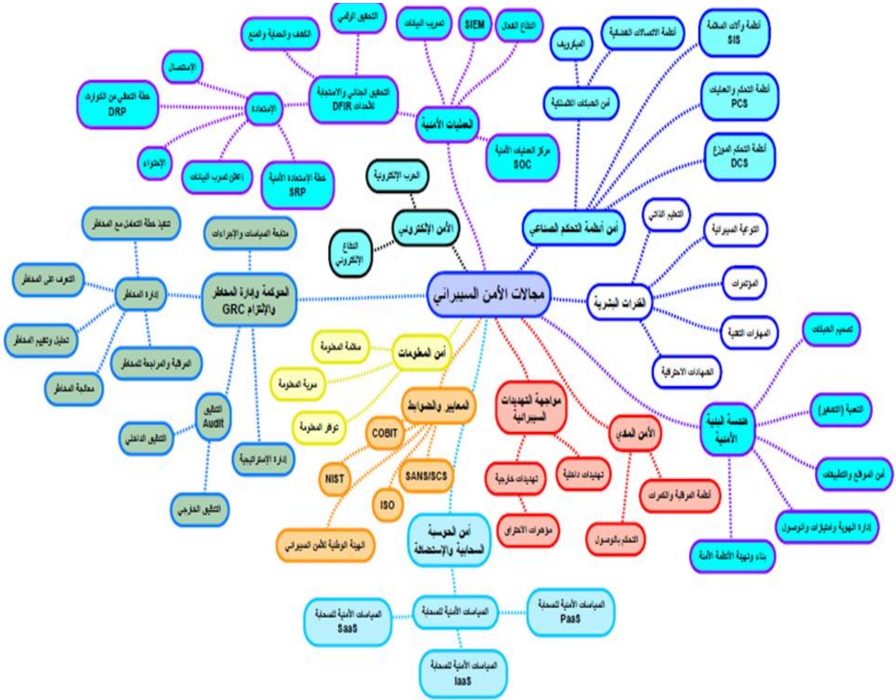
الشكل رقم (٣): مجالات الأمن السيبراني (المصدر الباحث)

ختاماً، الأمن السيبراني هو العلم والمجال القادم الذي سوف يعنى بأمن المعلومات والأمن الرقمي والأمن الإلكتروني والأمن المادي وأي أصول رقمية وغير رقمية موجودة في الفضاء السيبراني.