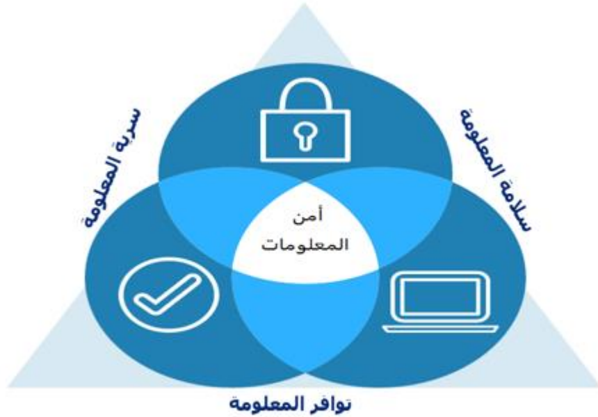
الشكل رقم (٢): عناصر أمن المعلومات CIA